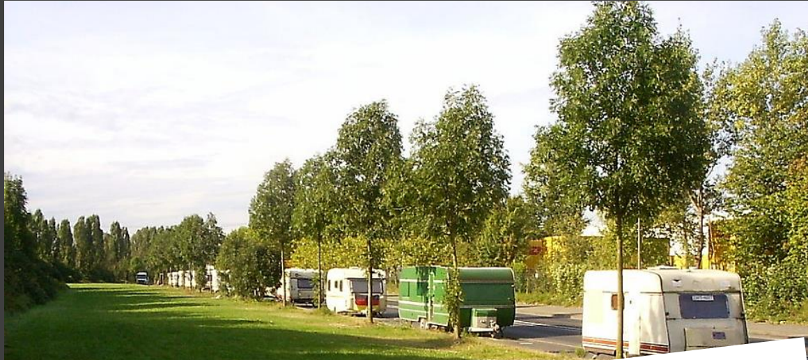
Alemania: Un grupo de caravanas conocidas como "Liebesmobile" (Móviles del amor) donde mujeres prostituidas se encuentran con compradores de sexo