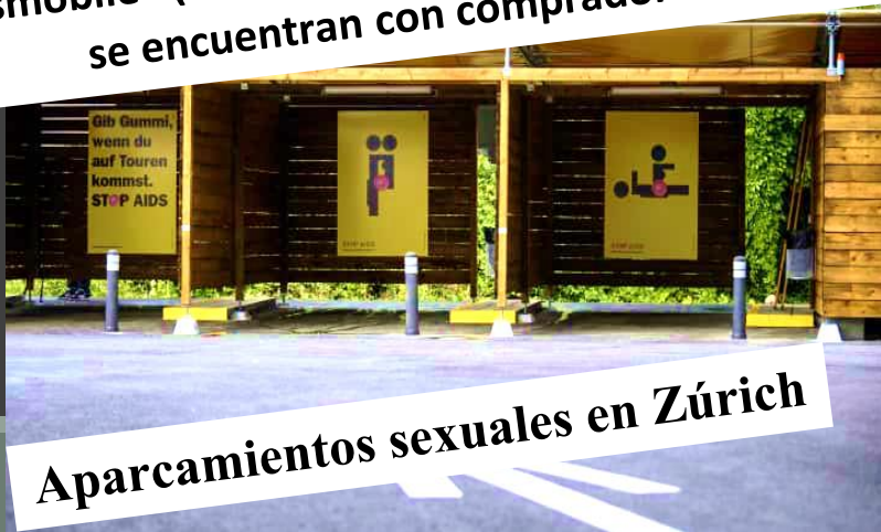
Aparcamientos sexuales en Zúrich