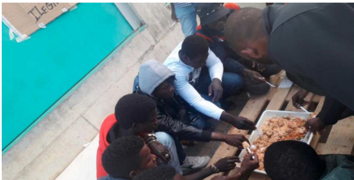
Un grupo de migrantes comparte una comida en el estadio de Lepe.