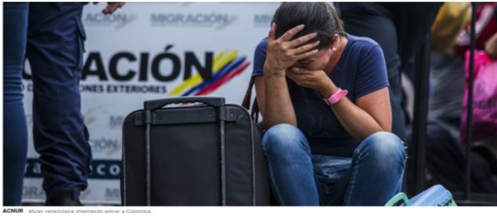
Mujer venezolana intentando entrar a Colombia

La Agencia de la ONU para los Refugiados considera que la mayoría de los venezolanos que huyen del país necesitan protección internacional como refugiados, dado el deterioro de la situación política, económica, de derechos humanos y humanitaria en su país.